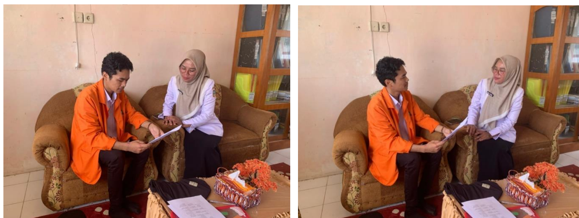
Gambar 3 Wawancara dengan Kepala Sekolah

Dalam upaya untuk memperoleh informasi yang mendalam mengenai pengaruh penggunaan gadget terhadap perilaku sosial siswa di lingkungan sekolah, peneliti melakukan wawancara dengan Kepala Sekolah SD Negeri 07 Mudiak Lawe. Wawancara ini dilaksanakan secara langsung dan berlangsung dalam suasana yang terbuka dan komunikatif.