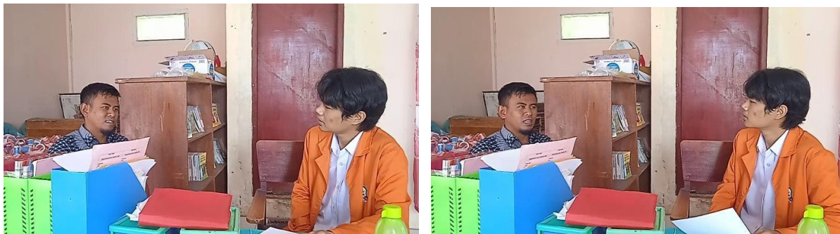
Gambar 4 Wawancara dengan Guru Kelas VI

Wawancara dilakukan dengan EM, EP dan RJ orang tua dari siswa kelas V SD Negeri 07 Mudiak Lawe. Wawancara ini bertujuan untuk memahami perspektif keluarga terkait penggunaan gadget dan dampaknya terhadap perilaku sosial siswa.