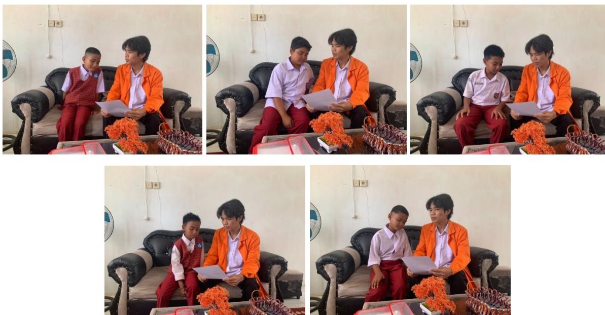
Gambar 12 Wawancara dengan Siswa Kelas V

Wawancara dilakukan dengan lima orang siswa kelas V SD Negeri 07 Mudiak Lawe untuk memahami perspektif langsung mereka terkait penggunaan gadget dan dampaknya terhadap perilaku sosial.