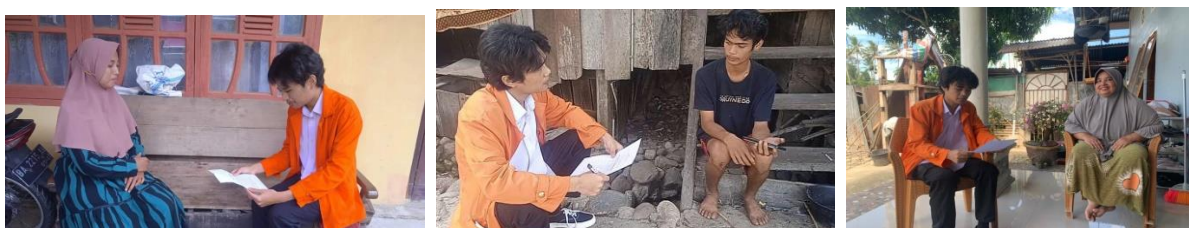
Gambar 5 Wawancara dengan Orang Tua

Wawancara dilakukan dengan EM, EP dan RJ orang tua dari siswa kelas V SD Negeri 07 Mudiak Lawe. Wawancara ini bertujuan untuk memahami perspektif keluarga terkait penggunaan gadget dan dampaknya terhadap perilaku sosial siswa.