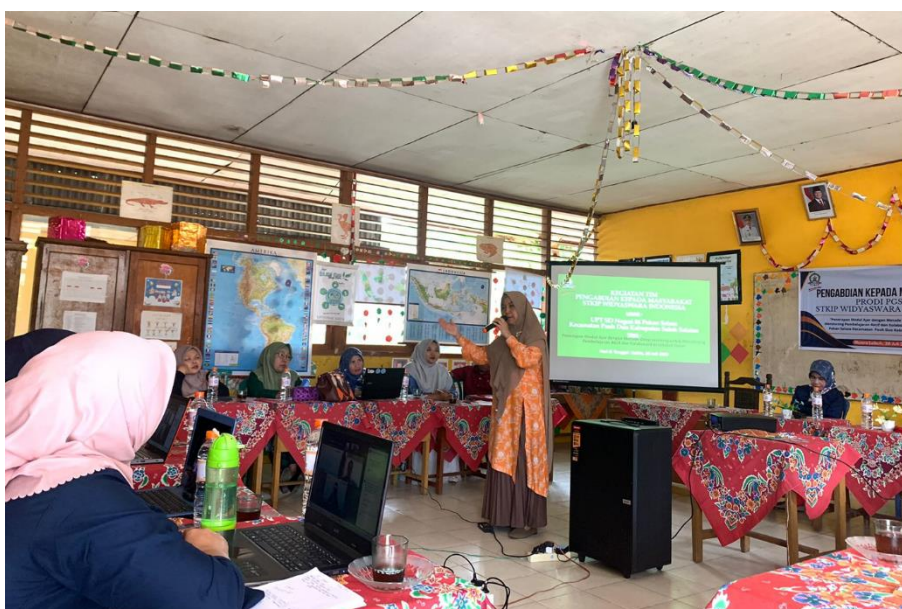
Gambar 5. Pemaparan cara Penerapan Modul Ajar Bahasa Inggris SD

Selanjutnya, masih dari pemateri dua yaitu pemaparan modul ajar yang merupakan turunan dari Tujuan Pembelajaran (TP). Modul ajar yang dijelaskan di dalam kegiatan adalah sebagai contoh yang bisa di jadikan panduan oleh guru-guru dalam menyusun modul ajar mata pelajaran lainnya yang mereka ajarkan. Pemaparan yang dijelaskan disini adalah bagaimana cara penerapan modul ajar dalam pembelajaran Bahasa Inggris yang disusun dan dijalankan dengan metode Deep Learning . Dalam memberikan penjelasan tentang penerapan modul ajar dalam bidang studi Bahasa Inggris berdasarkan kepada metode Deep Learning ini pemateri kedua ini menekankan bahwa selama proses belajar siswa tidak hanya menghafal kosakata tetapi memahami makna dan konteks bukan hanya bentuk, sehingga bisa menggunakan bahasa secara mandiri dalam situasi nyata.