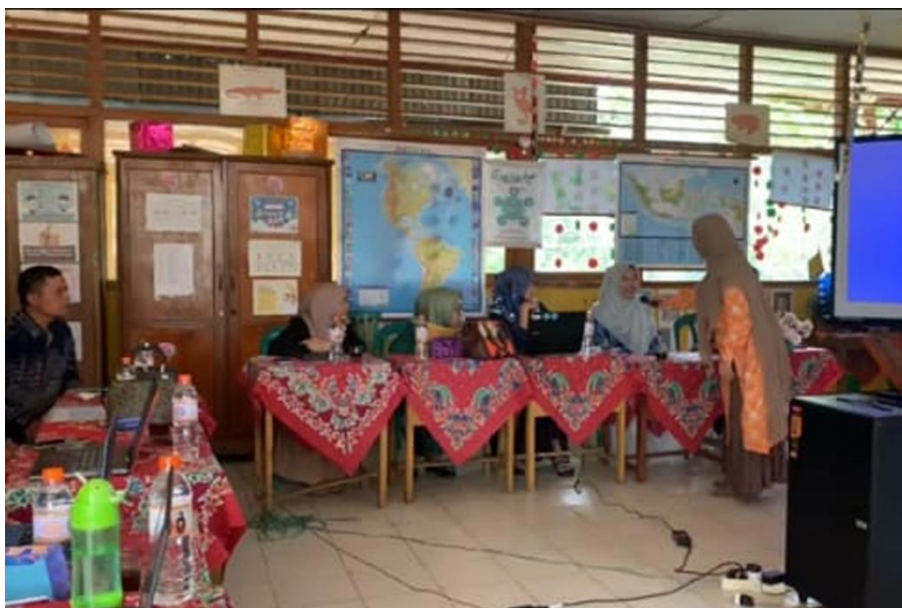
Gambar 4. Kegiatan Permainan Edukatif

Selanjutnya, masih dari pemateri dua yaitu pemaparan modul ajar yang merupakan turunan dari Tujuan Pembelajaran (TP). Modul ajar yang dijelaskan di dalam kegiatan adalah sebagai contoh yang bisa di jadikan panduan oleh guru-guru dalam menyusun modul ajar mata pelajaran lainnya yang mereka ajarkan. Pemaparan yang dijelaskan disini adalah bagaimana cara penerapan modul ajar dalam pembelajaran Bahasa Inggris yang disusun dan dijalankan dengan metode Deep Learning . Dalam memberikan penjelasan tentang penerapan modul ajar dalam bidang studi Bahasa Inggris berdasarkan kepada metode Deep Learning ini pemateri kedua ini menekankan bahwa selama proses belajar siswa tidak hanya menghafal kosakata tetapi memahami makna dan konteks bukan hanya bentuk, sehingga bisa menggunakan bahasa secara mandiri dalam situasi nyata.