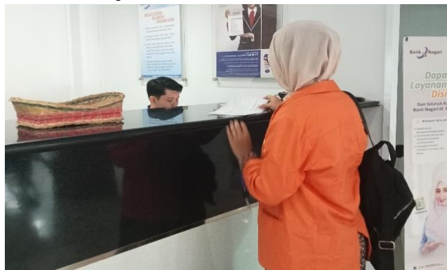
Gambar 3.6 Membayar pajak makan & minum

Penulis juga membantu membayarkan pajak makan dan minum sebagai bukti bahwa kantor Camat sungai pagu telah berkontribusi dan mematuhi peraturan dan terhindar dari potensi masalah perpajakan dimasa depan.