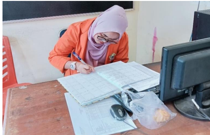
Gambar 3.3 Pengisian SPPD

Selanjutnya penulis disuruh membantu dalam pengisian Surat Perintah Perjalanan Dinas (SPPD), SPPD dokumen resmi yang diterbitkan oleh suatu instansi dengan tujuan untuk memberikan izin kepada pegawai yang akan melakukan perjalanan dinas itu merupakan salah satu kegiatan yang penulis lakukan selama KLM.