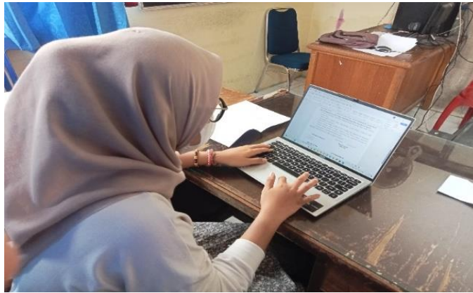
Gambar 3.5 Membuat laporan keuangan TPP dan TU

Sama hal-nya dengan GU penulis juga disuruh membuat template atau laporan keuangan untuk TPP dan TU, guna TPP adalah untuk bentuk insentif atau tunjangan yang diberikan kepada pegawai diluar gaji pokok sebagai penghargaan atau reward atas kinerjanya, sedangkan TU gunanya untuk memenuhi kebutuhan anggaran yang lebih besar dari sebelumnya. Makanya diperlukan laporan keuangannya untuk membuktikan atau untuk membuatnya lebih jelas untuk apa kegiatan keuangan itu digunakan.