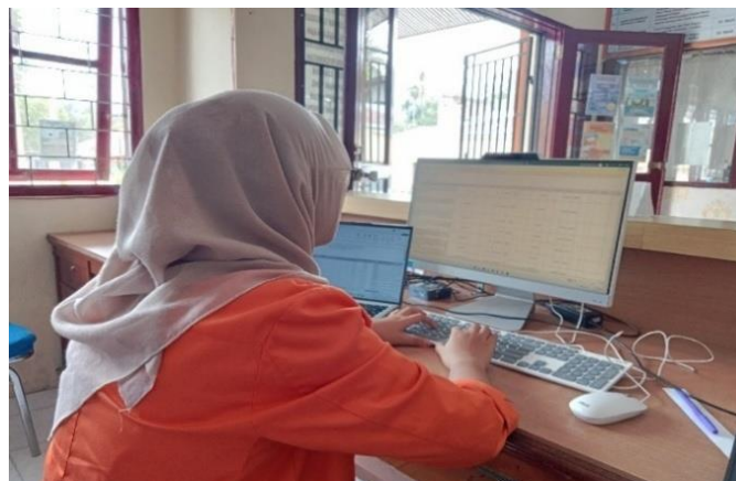
Gambar 3.7 Merekap Perjalanan Dinas

Selanjutnya penulis membantu pembuatan kode E-billing guna membuat kode E-billing untuk membantu memastikan pembayaran yang efisien dan akurat dalam proses pembuatan kode E-billing penulis juga disuruh membantu membuat Pajak Pertambahan Nilai (PPN) dan Pajak Penghasilan (PPH pasal 21).