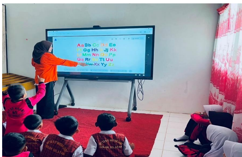
Gambar 2. Pelaksanaan Bimbingan Membaca Mengeja

Bimbingan membaca dan mengeja dilakukan setiap hari Selasa dan Rabu secara teratur selama satu jam sebelum waktu istirahat. Pendampingan dilakukan secara bertahap dengan memberikan latihan untuk mengenali huruf, suku kata, kata, hingga kalimat yang mudah. Pelaksanaan yang dilakukan berulang kali bertujuan agar murid terbiasa berlatih membaca secara terus-menerus.