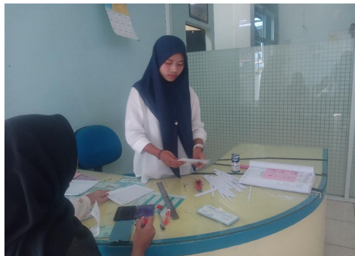
Gambar 1 Pelayanan Nasabah

Pada bidang pelayanan kredit, mahasiswa membantu proses administrasi pengajuan kredit, penyusunan dan pengarsipan berkas calon debitur, serta mendukung kelengkapan dokumen yang dibutuhkan dalam proses analisis kredit. Selain itu, mahasiswa juga turut mengikuti survei lapangan bersama pihak bank untuk menilai kelayakan calon nasabah. Kegiatan survei ini memberikan pengalaman langsung kepada mahasiswa dalam memahami proses analisis kredit yang tidak hanya berfokus pada kelengkapan administrasi, tetapi juga mempertimbangkan kondisi ekonomi, karakter, kemampuan pembayaran, serta potensi risiko dari calon debitur.