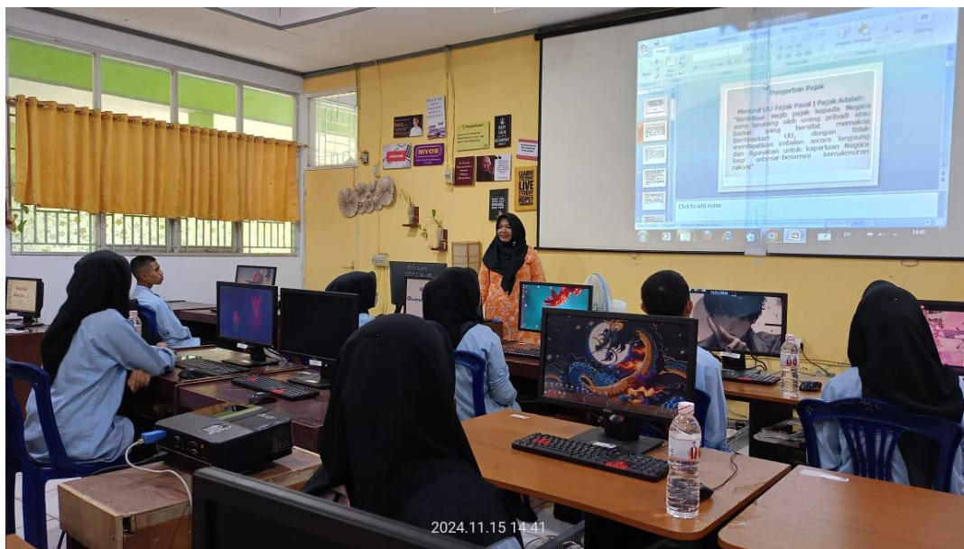
Gambar1 Menjelaskan Materi Tentang Pajak Penghasilan Pasal 21 (PPh 21)

Sebelum kegiatan ini dilaksanakan, kita sudah meminta pada siswa-siswa SMKN Solok Selatan peserta untuk Menyediakan alat tulis seperti buku, pena, penggaris dan kalkulator .