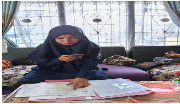
Gambar 2 Melakukan daftar online siswa baru