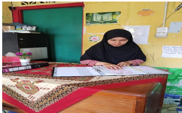
Gambar 3 Merekap kwitansi pembayaran SPP dan uang pendaftaran siswa baru

Kegiatan ini dilakukan dengan mengumpulkan dan merekap seluruh kwitansi pembayaran uang sekolah (SPP) dan uang pendaftaran siswa baru secara berkala. Rekapitulasi mencakup data identitas siswa, tanggal pembayaran, serta jumlah dana yang diterima. Tujuan dari kegiatan ini adalah untuk memastikan seluruh penerimaan keuangan telah terdokumentasi dengan baik, memudahkan proses pengecekan ulang, serta mendukung ketertiban administrasi dan keakuratan laporan keuangan sekolah.