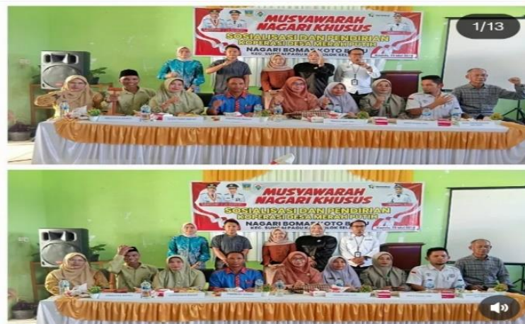
Gambar 4 Menjadi sekretaris Koperasi Merah Putih