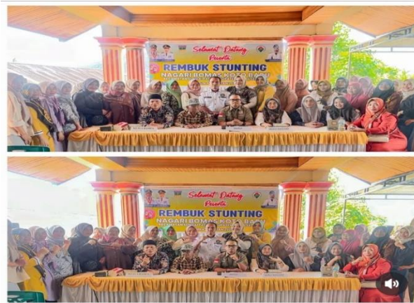
Gambar 5 Kegiatan Rembuk Stunting Nagari Bomas