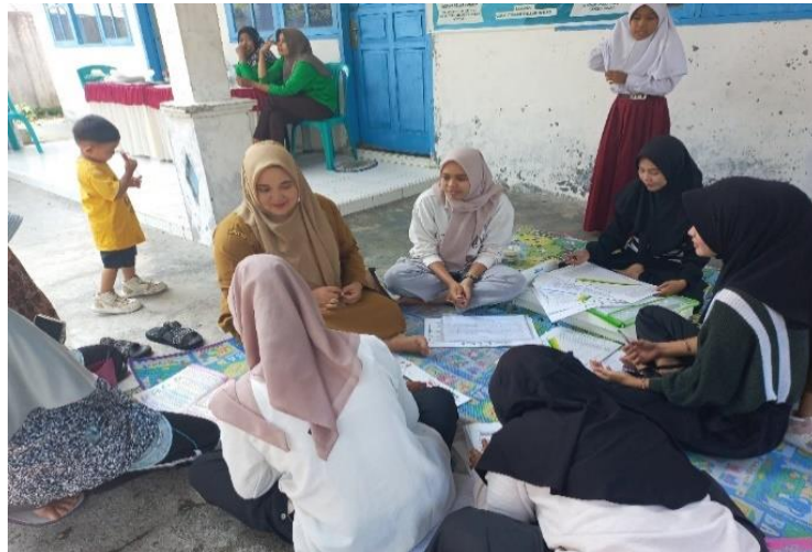
Gambar 3 Kegiatan PKL di Posyandu Mato Aia

dengan kebutuhan masyarakat setempat. Saya berharap upaya kecil ini dapat memberikan dampak positif bagi peningkatan kesehatan masyarakat bomas.