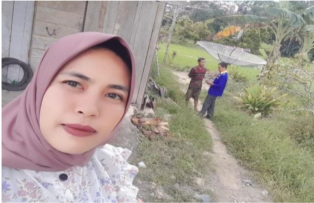
Gambar 3 Dokumentasi saat penjemputan pinjaman ke rumah nasabah

Membantu dalam penjemputan tabungan dan penagihan nasabah kredit. Penjemputan tabungan nasabah adalah salah satu keunikan dari BPR agar mempermudah bagi nasabah dalam menabung tanpa harus kebank dan mengantri, serta menjemput tabungan harian nasabah kredit agar mempermudah dalam melakukan pembayaran pinjaman. Melakukan penagihan terhadap nasabah kredit yang telah terlambat dalam melakukan pembayaran pinjaman.