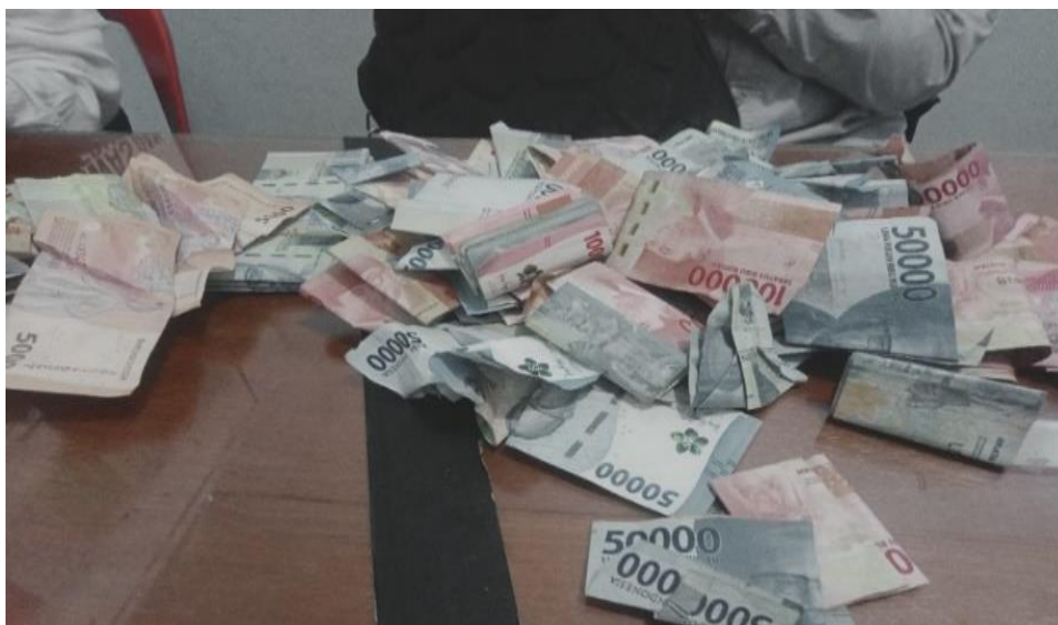
Gambar 3.4 Proses penghitungan uang setelah semua karyawan pulang dari lapangan

Proses membantu karyawan melakukan penghitungan uang tabungan dan kredit nasabah. Kegiatan ini dilakukan setiap hari, setelah semua proses penjemputan dilakukan oleh seluruh karyawan lapangan dan setelah semua selesai saya juga ikut membantu karyawan tersebut menghitung jumlah uang setoran yang didapat pada hari itu, dan itu dilakukan setiap hari.