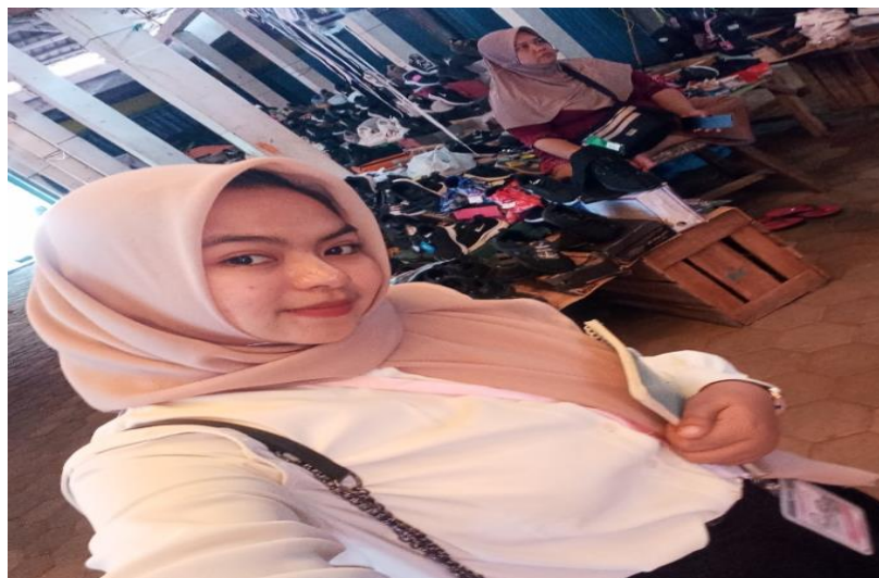
Gambar 2. Proses penjemputan tabungan di Padang aro